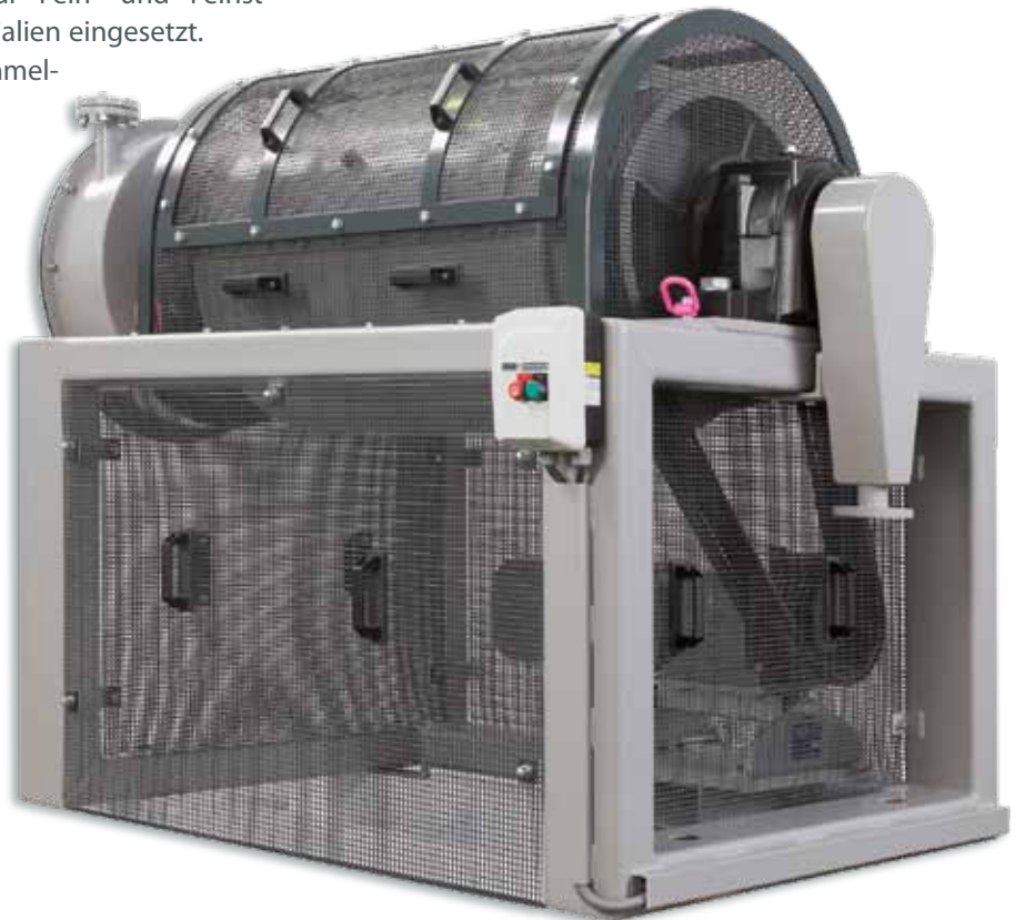
kontinuierliche TNS 200 K

Die Trommelmühlen werden zur Fein- und Feinstzerkleinerung von spröden Materialien eingesetzt. Diskontinuierlich betriebene Trommelmühlen ermöglichen neben der Zerkleinerung auch eine Homogenisierung des Mahlgutes.