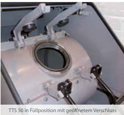
TTS 50 in Füllposition mit geöffnetem Verschluss

Eine Positionierung der Mahltrommeln in die Befüll- bzw. Entleerungsstellung, erfolgt im Tippbetrieb oder über eine optionale Steuerung mit automatischer Positionierung.