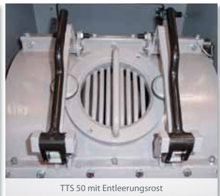
TTS 50 mit Entleerungsrost