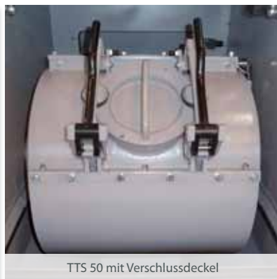
TTS 50 mit Verschlussdeckel